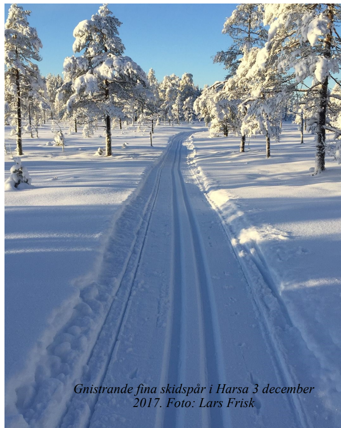
Gnistrande fina skidspår i Harsa 3 december 2017.