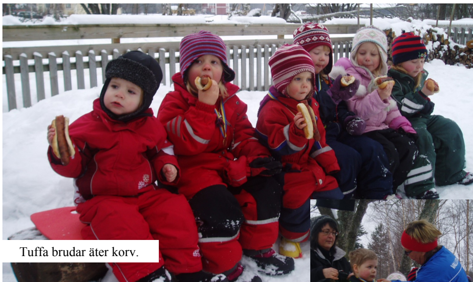
Tuffa brudar äter korv.

En dag i slutet på februari hjälpte Vallsta SK till att anordna ett skidlopp mellan Sälen och Mora. Flera barn åkte den knappt 1 kilometer långa banan flera gånger andra var nöjda efter ett varv i den korta banan, men alla var lika glada. De hade samlats både far-, mor- och föräldrar som hejade fram skidåkarna. Efter medaljutdelningen bjöd vi barnen och fröknarna på korv. Även fröknarna som åkte loppet fick medalj.