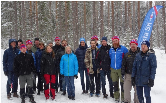
Vasaloppsresan passerade VSK-kontrollen i Vasslan.

En stor snackis inom Frisk-familjen har varit om VSK-bladets redaktör skulle hinna få barn före Vasaloppen så att karln hennes skulle kunna åka loppet. Redaktören fick en Oskar kl. 11.15 på lördagen innan loppet så en stolt fader kom till oss kl. 20.00 på kvällen.