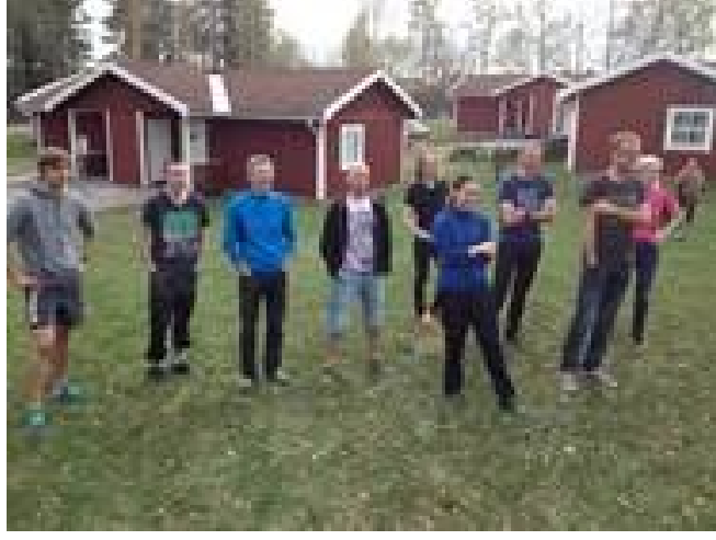
Bilden visar ett glatt gäng på träningläger i Falun!